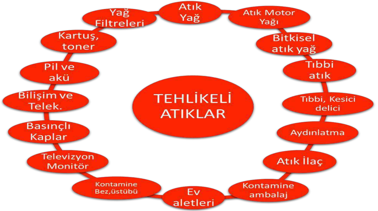
Resim-2: Tehlikeli Atıklar