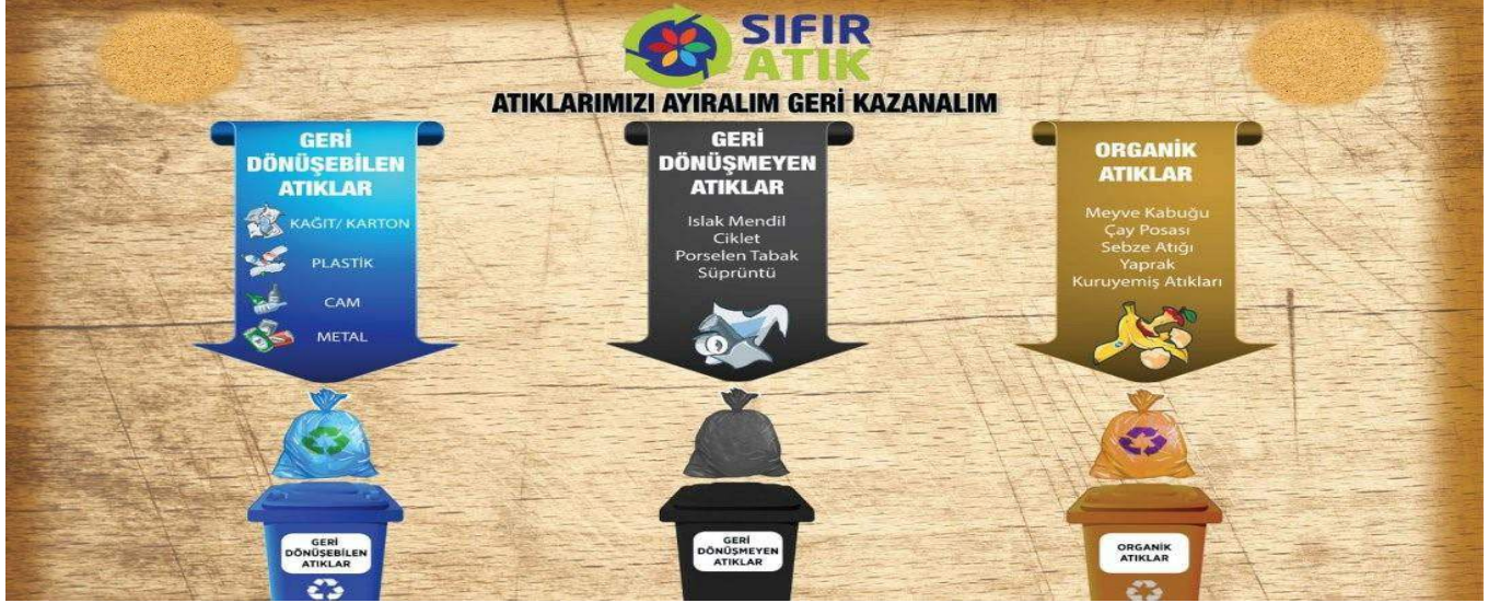
Resim-3: Renk Skalası

d. Günlük yaşamda ve çalışma hayatında kullanılacak ürünlerde, kullanıldıktan sonra doğaya salınımları en zararsız ürünleri kullanmak,