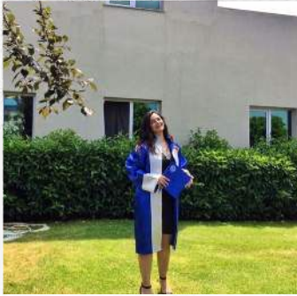
Canseli Yıldız İç Mimarlık - 2019 Canseelli Mimarlık, Kurucu