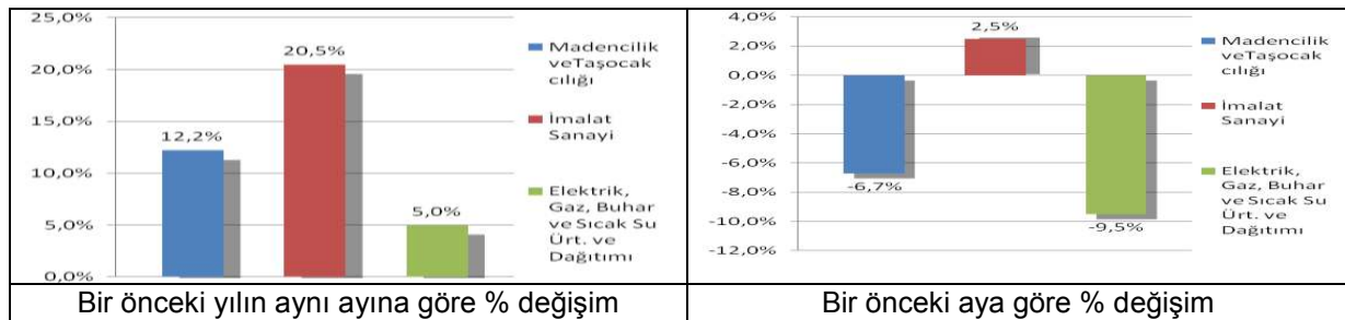
Grafik 2. Sanayi üretim endeksinde Alt Grup Bazında Değişimler

Sanayi üretiminin artmasında özellikle ihracat büyüklüğü önemli bir rol oynamaktadır. Piyasalardan gelen bu olumlu havanın devam etmesi için ihracatta teşviklerin artırılması ve işgücü maliyetlerinin azaltılması sanayi sektörüne önemli bir ivme kazandıracaktır. Şubat ayı verileri, Ocak ayına göre daha olumlu bir görünüm sergilemektedir. Sanayi sektörüne sağlanacak teşviklerle 2010 yılı ilk çeyreğinde daha olumlu büyüme rakamları elde edilebilir.